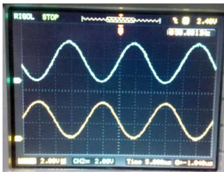
图4: 经过RC滤波后两路反相的正弦波50.001HZ